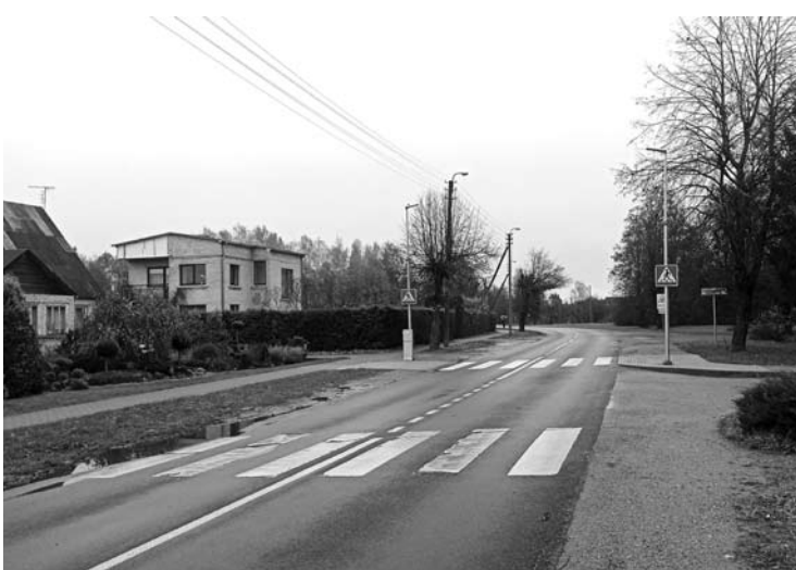
Šalia Troškūnų ambulatorijos įrengus naują pėsčiųjų perėją, paliktas ir senosios perėjos ženklinimas.

Tad Troškūnuose senąją perėją einantis ir automobilio kliudytas žmogus greičiausiai būtų pats pripažintas kaltu dėl eismo įvykio.