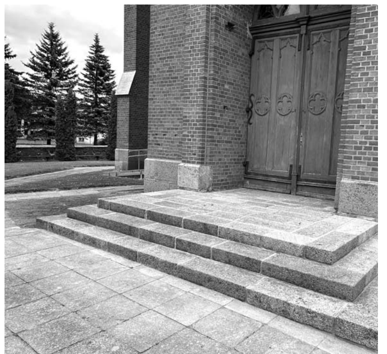
Buvo sutvarkyti Viešintų Šv. arkang. Mykolo bažnyčios laiptai. Anykščių rajono savivaldybė iš biudžeto tam skyrė 7 700 Eur, mecenatai paaukojo dar 4 088 Eur.