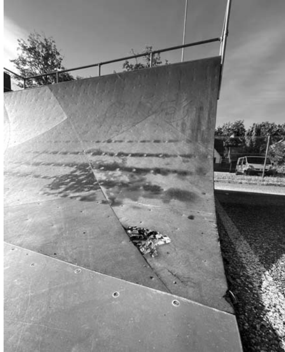
Vaikų žaidimo aikštelė ir riedutininkų rampa Anykščių miesto parke kelia pavojų.