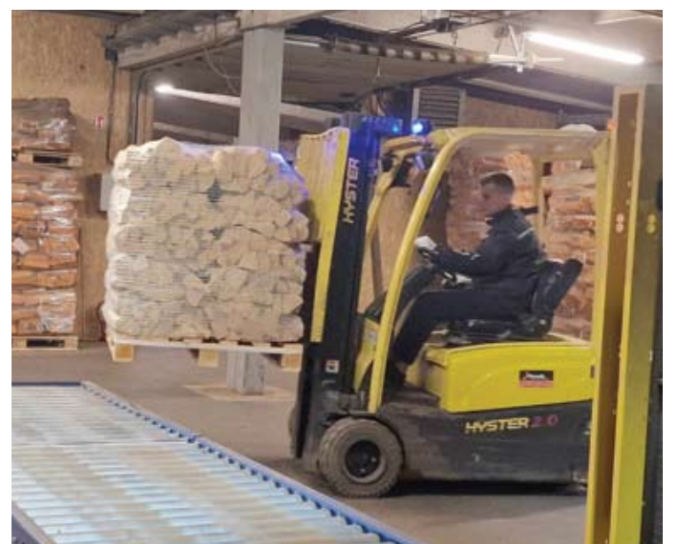
Išdžiovintos ir supakuotos anykštėnų malkos eksportuojamos į Vakarų Europą.