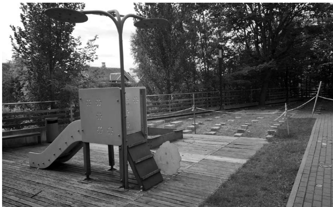
Šaltupio gatvėje vaikai ilgą laiką karstėsi taip atrodančioje nesaugioje vaikų žaidimų aikštelėje.