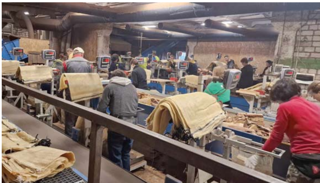
UAB „Vli Timber“ yra įdarbinusi apie 160 darbuotojų.

Viso malkų gamybos proceso įmonei automatizuoti kol kas nepavyksta. D. Lackus aiškino, kad malkų gamyba – specifinis verslas, todėl visos reikiamos įrangos paprasčiausiai nėra rinkoje. „Skaldymas jau praktiškai automatizuotas, tačiau pakavimo įrangos rinkoje nėra. Kažką perkame, kažką patys kuriame. Šioje sferoje tikrai dar turime, kur tobulėti“, – sakė verslininkas. (Nukelta į 14 psl.)