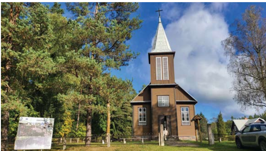
Buvusi šviesi Inkūnų bažnytelė po remonto nutamsėjo. Anykščių savivaldybė tam skyrė 10 700 Eur, žmonės paaukojo 7 587 Eur, dar 492 Eur buvo gauti iš gyventojų pajamų mokesčio.

Nors didžioji dalis anykštėnų yra katalikai, parapijiečiai neįstengia išlaikyti Dievo namų.