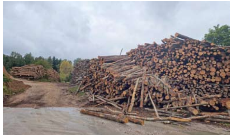
Žaliavinę medieną „Vli Timber“ perka ne didesniu nei 150 km spinduliu nuo įmonės.

Malkos – pigus produktas, tad jų transportavimo išlaidos sudaro reikšmingą dedamąją galutinėje kainoje. „Skandinavai iš Lietuvos labai daug eksportuoja beržo popiermedžio. Transportuoti žaliavą yra dar brangiau negu transportuoti jau išdžiovintą ir supakuotą produktą. Ir mūsų kainoje nemažą dalį sudaro transportavimas, tačiau popiermedis gali būti naudojamas tik malkoms arba celiuliozės gamybai. Baltijos valstybėse celiuliozės fabrikų nėra. Tad daug popiermedžio į Vakarus išvažiuoja tiesiog kaip žaliava. Parduodant išdžiovintą, paruoštą produktą, atsiranda pridėtinės vertės, tad Lietuva gauna dvigubai daugiau naudos. Mes žaliavą perkame apie 150 km spinduliu nuo gamyklos.